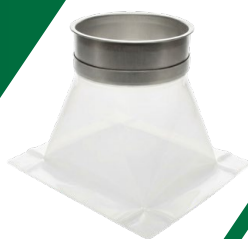
Redondo ↔ Rectangular

Amplia gama de conectores y geometrías que permite diseñar soluciones a medida, garantizando flexibilidad, estanqueidad y facilidad de montaje.