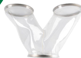
Derivaciones y piezas especiales

Diseñadas para garantizar un funcionamiento fiable en aplicaciones vibrantes u oscilantes