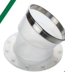
Redondo ↔ Redondo/Oval